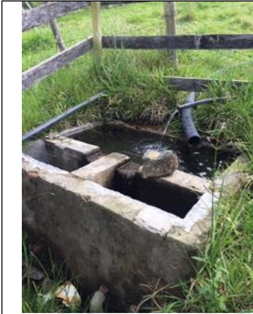
Imagen 6: Obra De Captacion Y Control De Caudal "Fuente 3 La Morena"