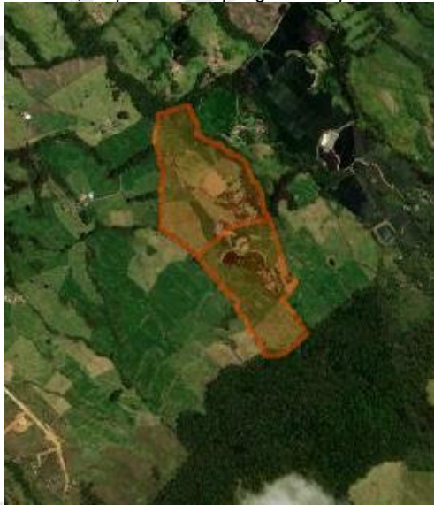
Imagen 1: Ubicación Del Predio Identificado Con FMI 017-2566 Y 017-2567