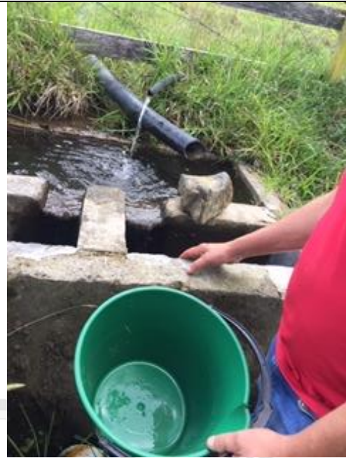
Imagen 7: Obra De Captacion Y Control De Caudal "Fuente 3 La Morena"