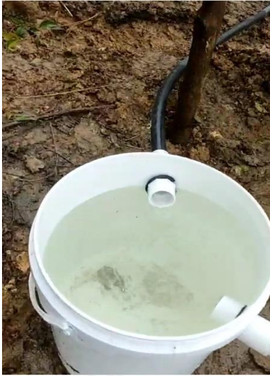
Obra de Control de caudal Implementada