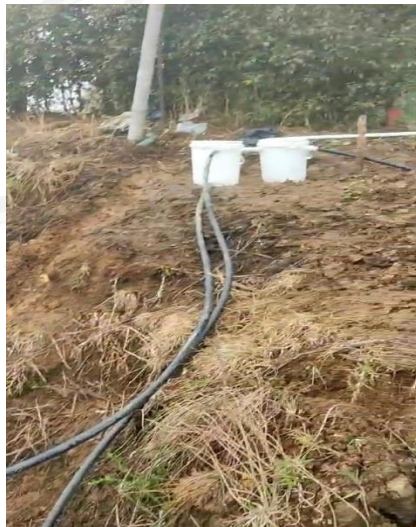
Obra de Control de caudal Implementada