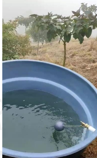
Tanque de Almacenamiento del predio