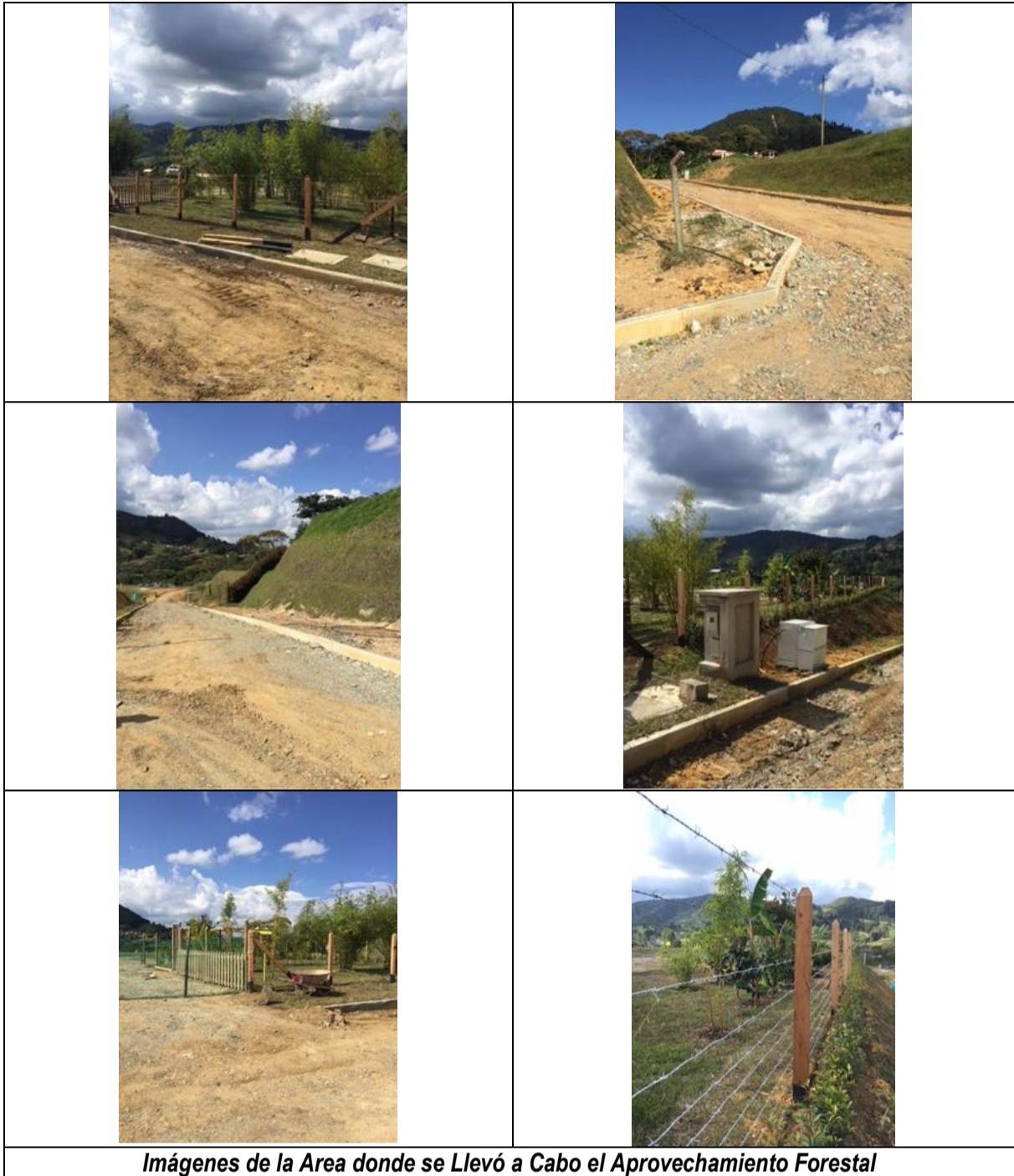
Imágenes de la Area donde se Llevó a Cabo el Aprovechamiento Forestal

- A continuación se presenta la tabla de verificación de cumplimiento de las obligaciones: