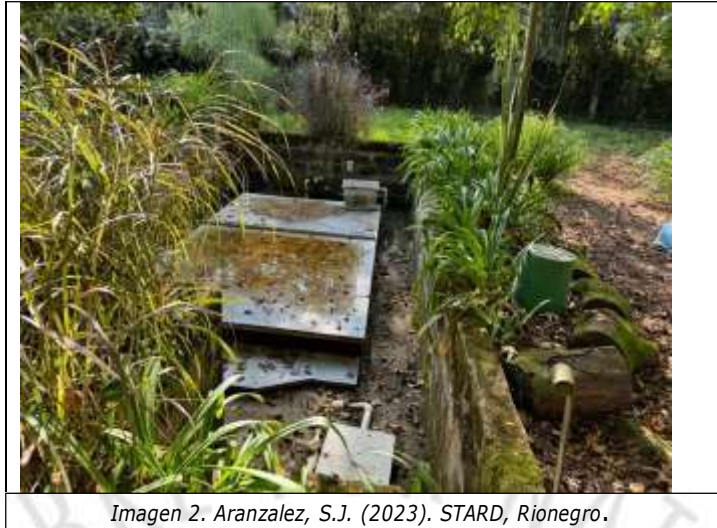
Imagen 2. Aranzalez, S.J. (2023). STARD, Rionegro.

Verificación de Requerimientos o Compromisos: Resolución RE-04127-2023 del 25 de septiembre del 2023, por medio de la cual se impone una medida preventiva y Resolución 131-1189-2013 del 17 de diciembre del 2013, por medio de la cual se otorga un permiso de vertimientos.