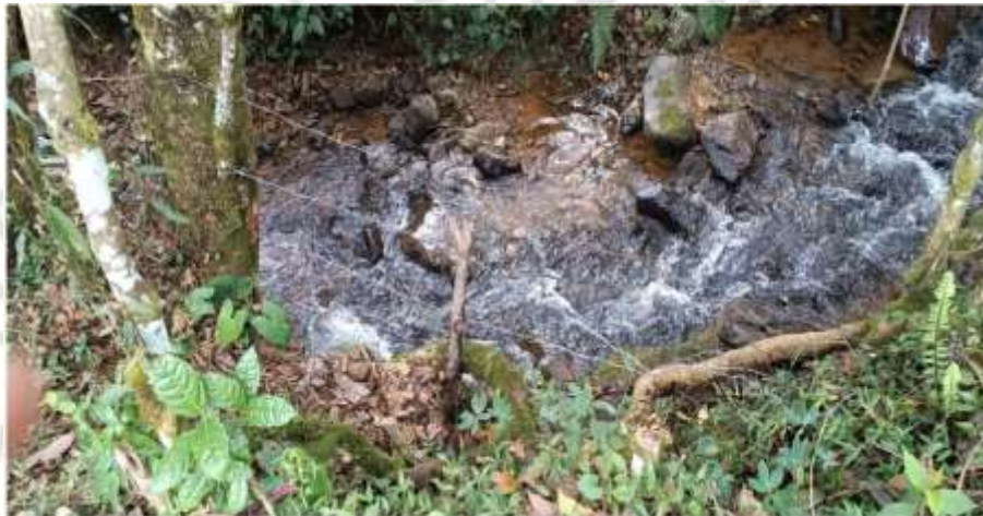
Imagen 1. Aranzalez, S.J. (2023). Punto de abastecimiento, Guarne.

Verificación de Requerimientos o Compromisos: CS-11704-2022 del 11 de noviembre de 2022 y Resolución 131-0023-2018 del 12 enero de 2018, por medio de la cual se otorga un permiso de concesión de aguas superficiales.