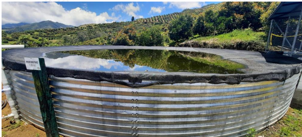
Tanque de almacenamiento y distribución

Del sistema de control de caudal el recurso es conducido a un sistema de almacenamiento tipo tanque australiano en donde se tiene instalado un micromedidor, de este tanque es distribuido para el uso doméstico y el uso agrícola, aunque se cuenta con Macromedición no se están llevando registros y, por ende, no se han presentado a Cornare.