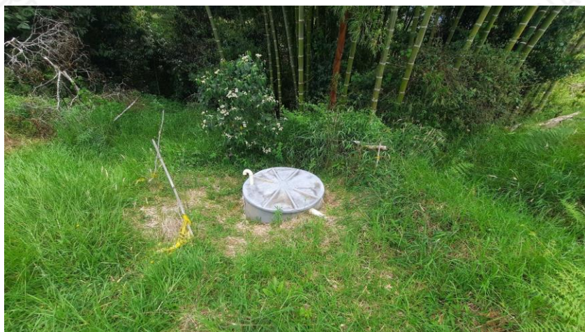
Pozo Séptico sin derrames