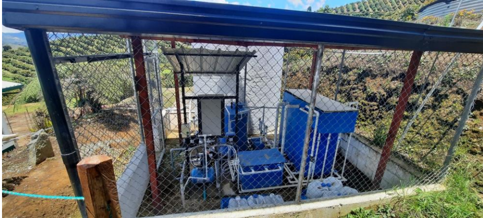
Planta de Tratamiento de agua potable

Poseen Planta de Tratamiento de Agua Potable para el uso doméstico, los subprocesos cuentan con micromedición pero tampoco se lleva registro de los mismo.