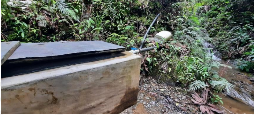
Captación y obra de control de caudal

En el predio la Cumbre captan el agua desde la fuente denominada, La Cumbre, en las coordenadas WGS84: -75°19'42.1" y 05°45'56.4" a 2232msnm, la captación es realizada en una pequeña presa de derivación y por aducción llevada a un sistema de control de caudal en mampostería en donde el sobrante es llevado a la misma fuente, los diseños presentados en la CE-02455-2023 del 09 de febrero de 2023 no evidencian memorias de cálculo para establecer si se está captando el caudal requerido,