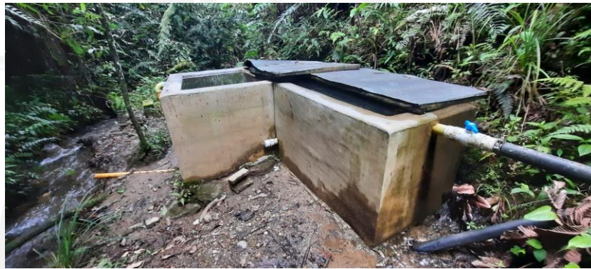
Obra de control de caudal con excedente a fuente

Del sistema de control de caudal el recurso es conducido a un sistema de almacenamiento tipo tanque australiano en donde se tiene instalado un micromedidor, de este tanque es distribuido para el uso doméstico y el uso agrícola, aunque se cuenta con Macromedición no se están llevando registros y, por ende, no se han presentado a Cornare.