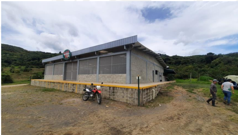
Bodega de postcosecha

Se encuentra una construcción como bodega de postcosecha con baños para empleados y cocineta conectada a pozo séptico que no presenta derrames o vertimientos ni a fuente hídrica ni a suelo, las aguas residuales son recogidas por Sercepco