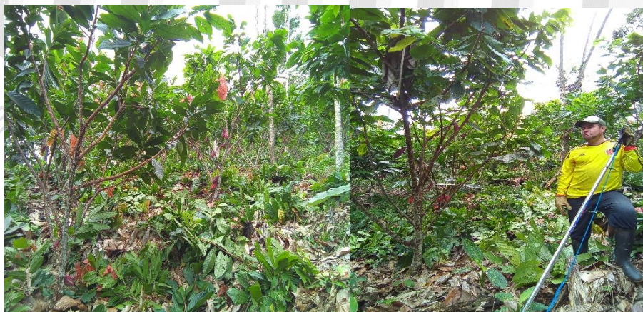
Figuras 4 y 5. Areas instaladas en SAF Cacao - Forestales. Vereda Altavista. Municipio de San Luis. Ant. 2023.