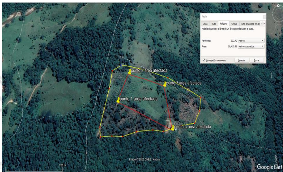
Figura 3. Área total del predio afectado por quema accidental inmerso en actividades de restauración productiva. . Vereda Altavista. Municipio de San Luis . Ant. Imágenes Google Earth 2023.

5°57'19,00" N - 74°49'38,80" W, 5°57'15,40" N - 74°49'38,60" W) se observa que este tiene un área aproximada de 1,61 hectáreas (Polígono Línea Roja Figura 3). Este polígono se encuentra inmerso dentro de un área de mayor extensión la cual se encuentra en proceso de restauración activa adelantada por el propietario del predio. El área de restauración productiva tiene una extensión de 5,04 hectáreas (Polígono Línea Amarilla Figura 3) con siembras y resiembras de árboles de cacao y forestales cercanas a la cantidad de 4.000 unidades. En general los árboles del sistema agroforestal verificado se encuentran en buen estado fitosanitario y estructural, con alturas que oscilan entre los 100 cm y 3,00 metros; la diferencia de alturas se debe a las resiembras realizadas debido a la reposición progresiva de individuos por mortalidad y dificultad para desarrollarse en suelos compactados por ganadería extensiva.