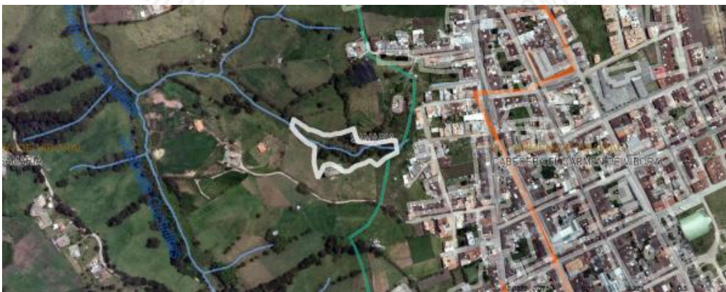
Imagen 1. Ubicación predio de interés

3.2 En cuanto al predio donde se ubican los árboles: corresponde al FMI 020-231703, sin embargo, en la información catastral de la Corporación se identifica el matriz, del matriz con FMI 020-164773, por lo que los determinantes ambientales serán mostrados para este de mayor extensión. Se encuentra ubicado en zona de expansión urbana, en la vereda Samaria del municipio de El Carmen de Viboral, presenta un paisaje de altiplanicie y un relieve de lomas y colinas, además, hace parte de la categoría de parcelaciones, con áreas destinadas a vivienda campestre del POT del municipio.