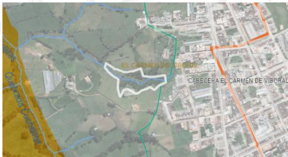
Imagen 2. Determinantes ambiental predio de interés

3.4 Localización de los árboles aislados a aprovechar con respecto a Acuerdos Corporativos y al sistema de Información Ambiental Regional: De acuerdo con el Sistema de Información Geográfica de Cornare, el predio de interés, se encuentra al interior de los límites del Plan de Ordenación y Manejo de la Cuenca Hidrográfica POMCA del Río Negro, aprobado en Cornare mediante la Resolución No. 112-7296 del 21 de diciembre de 2017 y mediante la Resolución No. 112-4795 del 8 de noviembre de 2018, estableció el régimen de usos, además, por medio de la resolución RE-04227-2022 del 1 de noviembre de 2022 se modifica el régimen de usos al interior del predio en: áreas urbanas (100%).