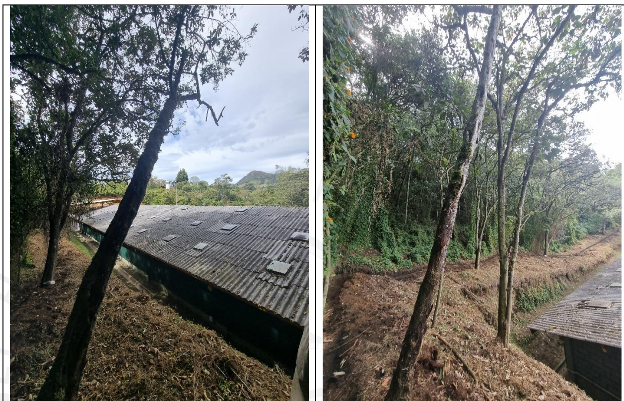
Imagen 3 y 4. Individuos a intervenir