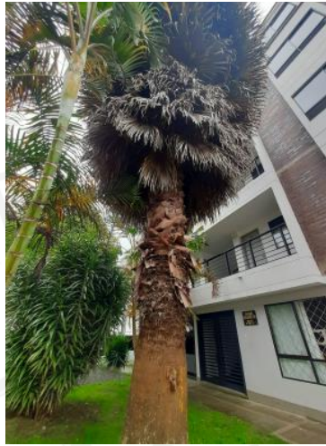
Imagen 7: Palma Washingtonia

especies e individuos vegetales del territorio nacional que no se han plantado o mejorado por el hombre, presentes en ecosistemas naturales diferentes al bosque natural. Incluye la flora acuática. Este último decreto establece que todo aquel interesado en adquirir el derecho al manejo sostenible de la flora silvestre deberá solicitar el respectivo permiso ante las autoridades competentes aportando el lleno de los requisitos legales.