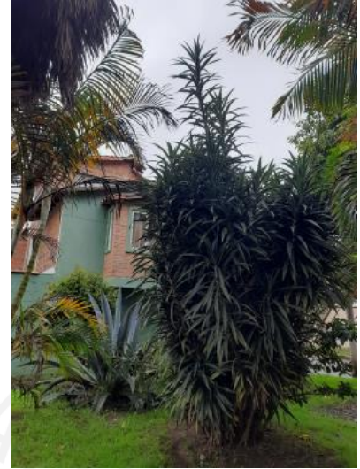
Imágenes 1, 2 y 3: Predio y vegetación existente.

En cuanto al Aguacatillo ( Persea sp. ), este corresponde a un espécimen adulto que presenta una altura aproximada de 10 metros, que se localiza entre la vía existente y el andén peatonal, cerca de las redes eléctricas.