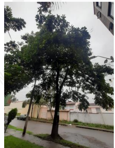
Imágenes 4, 5 y 6: Aguacatillo objeto de aprovechamiento.

Con relación al individuo de la especie Palma Washingtonia ( Washingtonia sp. ), este individuo presenta una altura aproximada de 6 metros, y es importante mencionar que corresponde a una especie introducida al país y la región, de acuerdo con lo establecido en el artículo 2.2.1.1.1. Definiciones., del Decreto 1076 de 2015 “Por medio del cual se expide el Decreto Único Reglamentario del Sector Ambiente y Desarrollo Sostenible” la flora es el conjunto de especies e individuos vegetales del territorio nacional que no se han plantado o mejorado por el hombre, asimismo, el artículo 1 del Decreto 690 de 2021 “Por el cual se adiciona y modifica el Decreto Único Reglamentario 1076 de 2015, del sector de Ambiente y Desarrollo Sostenible, en lo relacionado con el manejo sostenible de la flora silvestre y los productos forestales no maderables, y se adoptan otras determinaciones”, definió la flora silvestre como el conjunto de