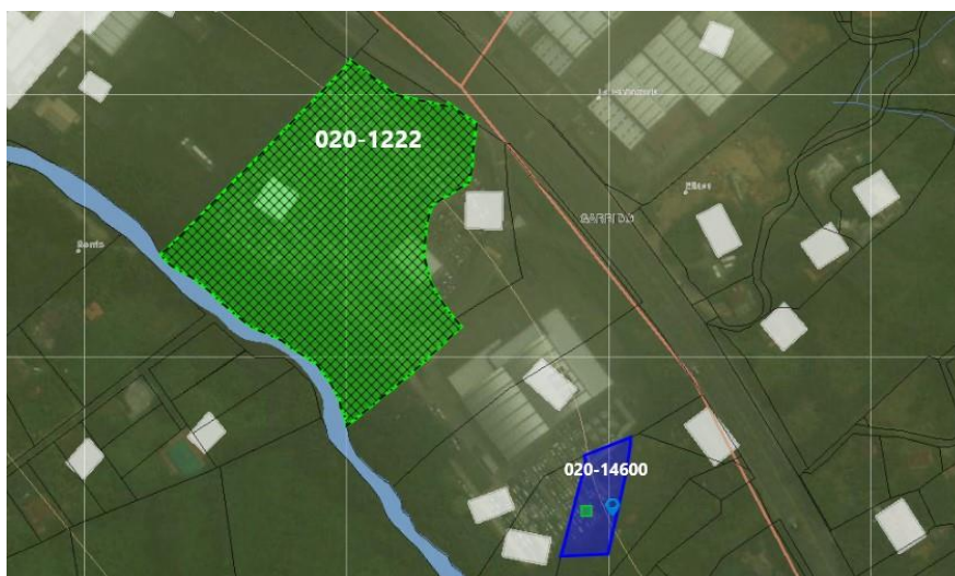
Imagen 1. Ubicación del árbol en predio azul y predio verde correspondiente al del Auto de inicio

3.2. En cuanto al predio donde se ubican los árboles: inicialmente el trámite se atiende en beneficio del predio con FMI 020-1222, sin embargo, con la verificación de las coordenadas tomadas en campo durante la visita, se identifica que el árbol de interés no se ubica al interior de este predio, sino, en el lote con FMI 020-14600, por lo tanto, se procede a verificar la información de la Ventanilla Única de Registro (VUR) por parte de la oficina jurídica de la regional, determinando que este predio también es propiedad de Suramericana. Siendo así, este permiso se evaluará en función del predio con FMI 020-14600.