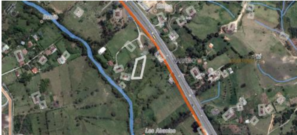
Imagen 2. Ubicación predio de interés

El predio 020-14600 se encuentra ubicado en la vereda Garrido del municipio de Guarne, presenta un paisaje de altiplanicie y un relieve de vallecitos, además, hace parte del corredor suburbano de actividad múltiple industrial de la doble calzada según el POT del municipio. El objetivo del aprovechamiento es prevenir accidentes por el secamiento total del árbol.