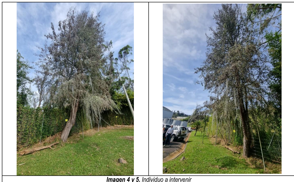
Imagen 4 y 5. Individuo a intervenir