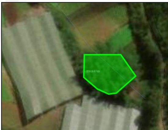
Imagen 3: Polígono rodal de Guadua.

A continuación, se presenta una imagen del polígono del predio y del rodal de Guadua objeto de aprovechamiento: