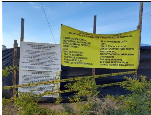
Imagen 1: Valla informativa sobre la licencia.

Además, el lote presenta áreas de pastos limpios, sus linderos contienen pastos arbolados y vegetación secundaria y un rodal de Guadua.