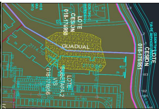
Imagen 4: Polígono objeto de aprovechamiento.

El aforo o medición realizada durante la visita arrojó un dato promedio de 7 culmos por m 2 , para un total estimado de 1960 culmos o tallos en total y un volumen de 196 m 3 aproximadamente.