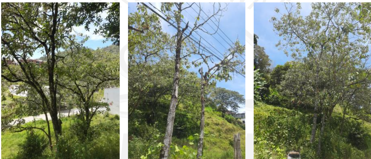
Imágenes 1, 2 y 3: árboles objeto de aprovechamiento.

Pese a ser especies nativas, los Dragos se han dado en el predio producto de regeneraciones naturales sin conformar coberturas densas.