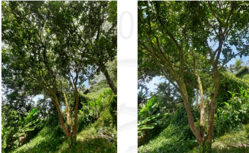
Imágenes 6 y 7: Guayabo.

El individuo que corresponde a la especie Guayabo ( Psidium guajava ), es una especie frutal ubicada en el predio de interés, para esta especie, según el artículo 2.2.1.1.12.13 del Decreto 1076 de 2015, “no se requiere permiso y/o autorización para el aprovechamiento de especies frutales para los individuos que tengan características leñosas”.