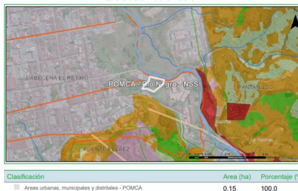
Imagen 8: Zonificación ambiental del predio según el POMCA.

De acuerdo con el Sistema de Información Geográfica de Cornare, el predio de interés hace parte de las áreas de uso múltiple delimitadas por el Plan de Ordenación y Manejo de la Cuenca Hidrográfica POMCA del Río Negro, aprobado en Cornare mediante la Resolución No. 112-7296 del 21 de diciembre de 2017, modificada por la Resolución RE-04227 del 1 de noviembre de 2022, así: