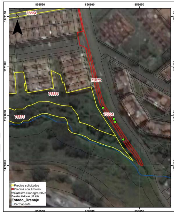
Imagen 1: Salida cartográfica de localización de los árboles respecto a los predios.

Así las cosas, se solicitó el certificado generado por la Ventanilla Única de Registro (anexos), de los predios con árboles (020-75872 y 020-75864), lo que, luego de la revisión jurídica, permitió identificar que estos inmuebles son propiedad del Municipio de Rionegro, titular del trámite, por lo que se considera factible conceptuar sobre la solicitud.