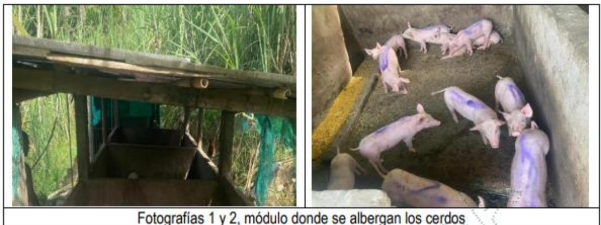
Fotografías 1 y 2, módulo donde se albergan los cerdos

En el predio identificado con FMI: 0029208 y PK:1972001000003800055 se desarrolla una actividad porcícola de ceba con un total de 16 lechones, el módulo que alberga los cerdos se encuentra construido en mampostería, pisos en concreto, techos Eternit y bebederos de chupón (ver fotografías 1 y 2).