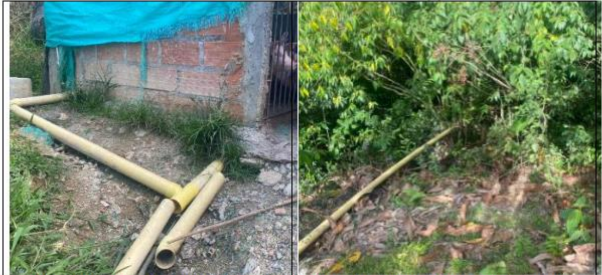
Fotografías 3 y 4. La descarga va directamente a la quebrada Santo Domingo sin tratamiento previo