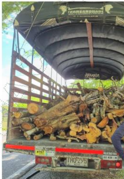
Figura 2. Furgoneta con material vegetal de subproductos de la actividad de tala.

3.3. Mediante georreferenciación y cruce cartográfico de la información catastral municipal, se encontró que el predio se identifica con matrícula inmobiliaria No. 018-100948 y PK 5912001000000200083, cuenta con un área de 36,7 ha y figura como propietaria la sociedad Agropecuaria Pozo Redondo S.A. con NIT. 900264552.