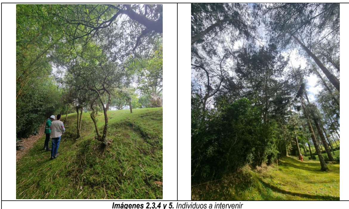
Imágenes 2,3,4 y 5. Individuos a intervenir