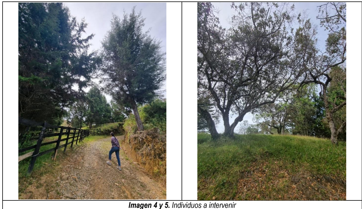
Imagen 4 y 5. Individuos a intervenir