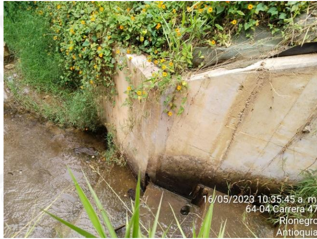
Ilustración 3. Aletas Box Coulvert