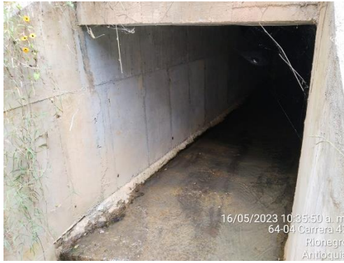
Ilustración 2. Box Coulvert sección transversal