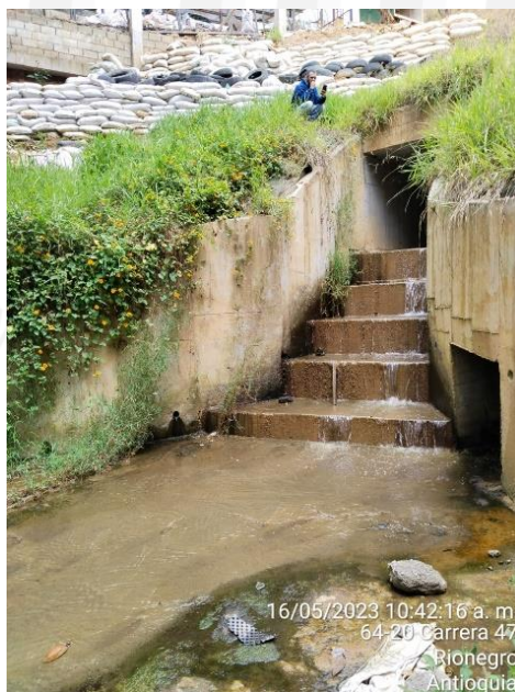
Ilustración 1. Box Coulvert vista general

En la visita realizada el 16 de mayo del 2023, se identificó que se realizó la obra #1, Box Coulvert, tal como se autorizó en la Resolución RE-00195-2023 del 18 de enero del 2023 y la obra #2 autorizada en la resolución RE-08435-2021 del de diciembre del 2021.