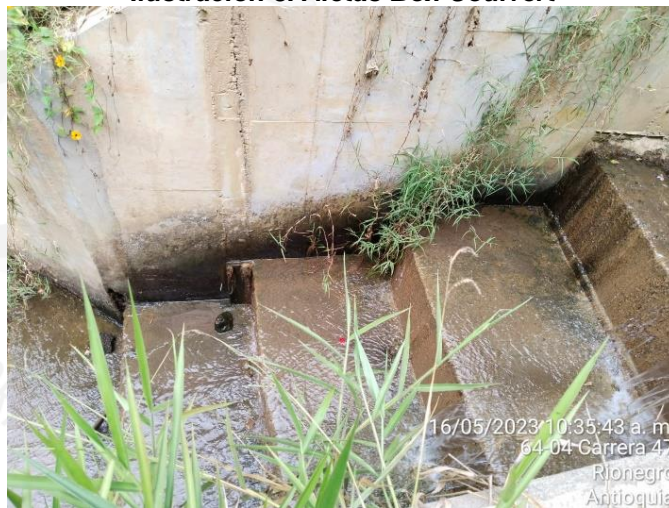
Ilustración 4. Escaleras disipadoras