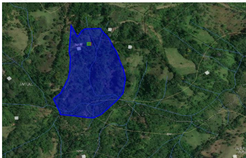
Imagen 1: Ubicación del predio.

El predio “La Romelia”, se identifica con los folios de matrícula inmobiliaria No 028-19845, se encuentra ubicado en la vereda Uvital del municipio de Nariño, tiene un área catastral de acuerdo al Sistema de Información Geográfica de Cornare de 6.1 Has.