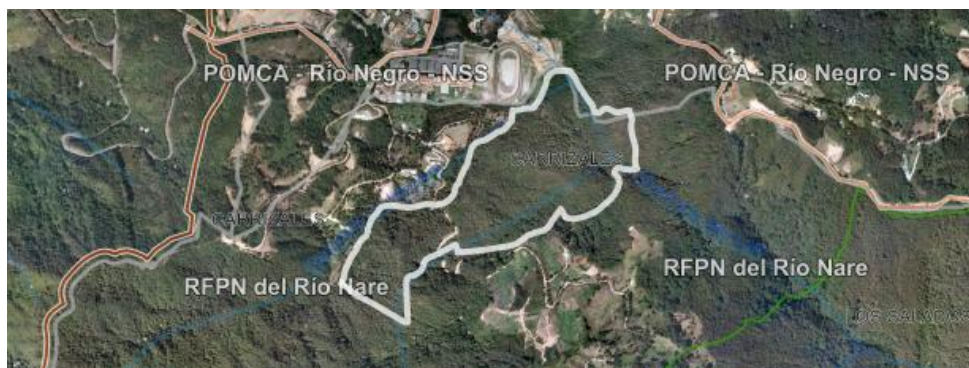
Imagen 1. Ubicación predio matriz

3.2. En cuanto al predio donde se ubican los árboles: de acuerdo con la información catastral del Geoportal de Cornare, el predio de interés con FMI 017-64295 se derivó de un matriz con FMI 017-19442, el cual es el identificado por el geoportal. Se encuentra ubicado en la vereda Carrizales del municipio de El Retiro, presenta un paisaje de montaña y un relieve de filas y vigas. El objetivo del aprovechamiento es adecuar el espacio para construcción de vivienda.