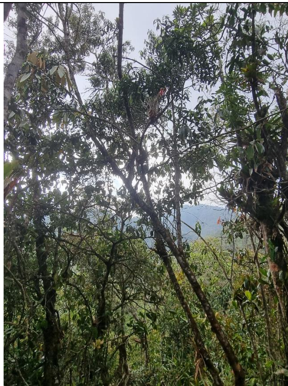
Imagen 4 y 5. Individuos solicitados