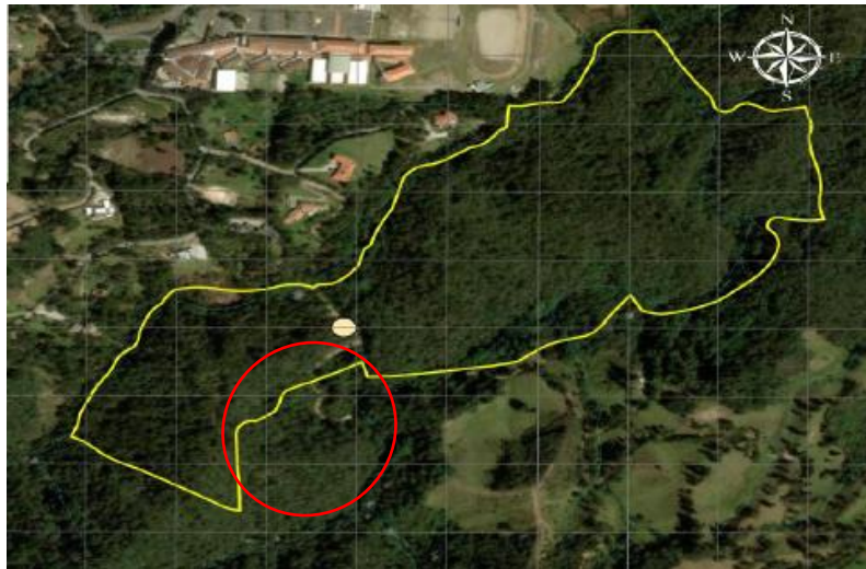
Imagen 2. Ubicación del predio de interés en predio matriz

en trámite una nueva licencia de construcción para una vivienda de 250 m 2 y adecuación de zonas verdes. Por lo tanto, en este momento, el predio no cuenta con licencia de construcción vigente.