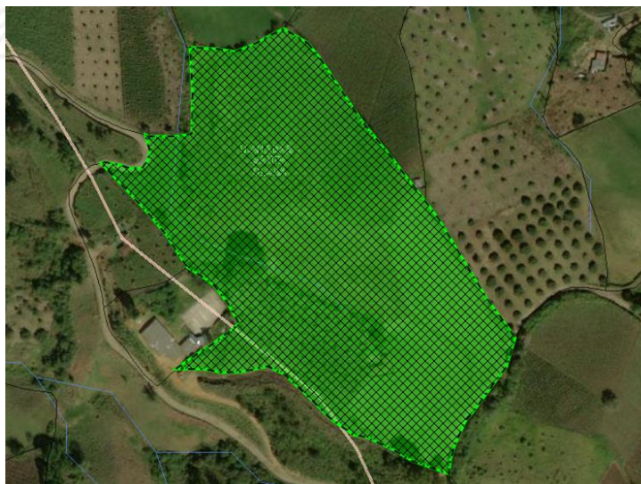
Imagen 1: Ubicación del predio.

El predio denominado Tres Esquinas, con FMI No 028-32465, de acuerdo con el sistema de información de CORNARE, tiene un área de 4.06 hectáreas. Para llegar al predio se toma la vía que desde el municipio de Sonsón conduce a la vereda Llanadas, por el barrio El Tapete. en el sector conocido como La perla, se toma desvío al costado derecho, continuando por carretera destapada hasta llegar a el sector Tres Esquinas, allí se toma vía del lado derecho y a 40 metros se encuentra el predio de nuestro interés