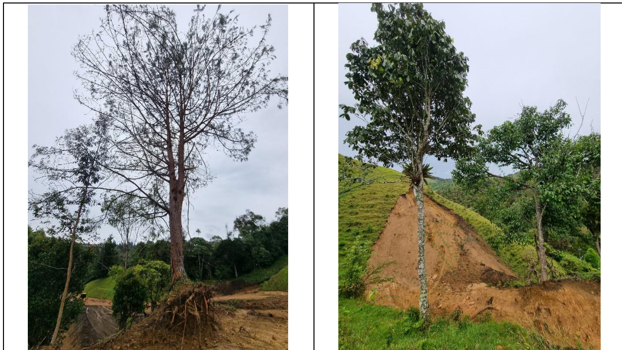
Imagen 3 y 4. Individuos a intervenir