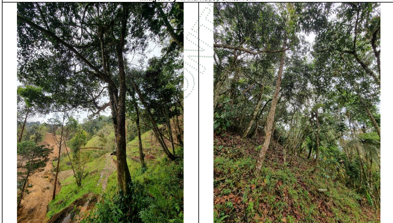
Imagen 5 y 6. Zona que no se podrá intervenir