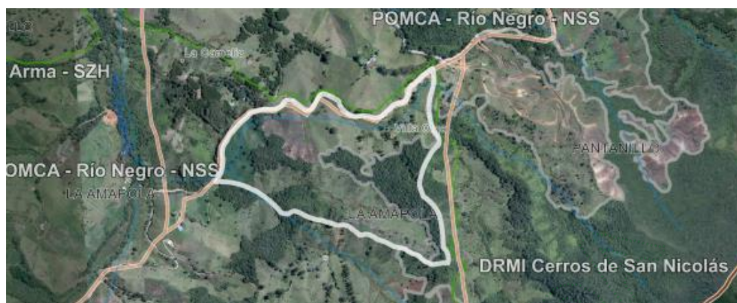
Imagen 1. Ubicación predio de interés

3.3. En cuanto a los individuos arbóreos de interés: se encuentran dispersos al interior del predio bajo diferentes coberturas, entre pastos arbolados, áreas artificializadas por extenso movimiento de tierras y vegetación secundaria alta, asociada con áreas de protección; no se identifican afluentes cercanos a la zona de intervención de los árboles. Durante la visita se realizó un recorrido por el área a intervenir con el fin de identificar los árboles objeto de solicitud, se tomaron puntos de ubicación geográfica y se realizaron mediciones dasométricas para la verificación del inventario forestal aportado.