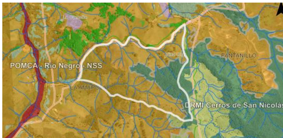
Imagen 2. Determinantes ambiental predio de interés

Áreas agrosilvopastoriles , las cuales corresponden a aquellas áreas, cuyo uso agrícola, pecuario y forestal resulta sostenible, al estar identificadas como en la categoría anterior bajo el criterio de no sobrepasar la oferta de los recursos, dando orientaciones técnicas para la reglamentación y manejo responsable y sostenible de los recursos suelo, agua y biodiversidad que definen y condicionan el desarrollo de estas actividades. En estas áreas se podrán desarrollar múltiples actividades sociales y económicas.