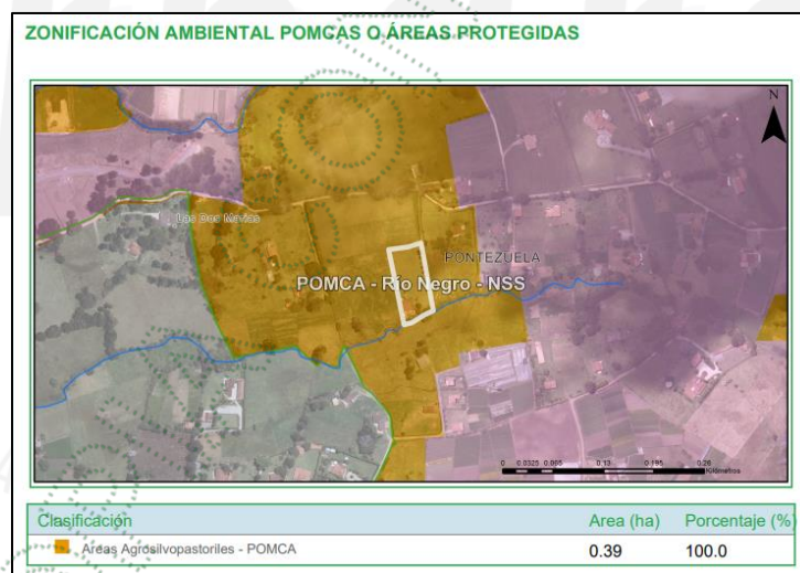
Imagen 1. Mapa de restricciones del predio identificado con FMI: 020-12879

De acuerdo con el Sistema de Información Geográfica de CORNARE, el predio con FMI 020-12879, hace parte del área delimitada por el Plan de Ordenación y Manejo de la Cuenca Hidrográfica POMCA del Río Negro, aprobado en CORNARE mediante la Resolución No. 112-7296 del 21 de diciembre de 2017, modificada por la Resolución RE-04227 del 1 de noviembre de 2022, por medio de la cual se establece el régimen de usos al interior de la zonificación ambiental del Plan de Ordenación y Manejo de la Cuenca Hidrográfica del Río Negro en la jurisdicción de Cornare. Presentando la siguiente zonificación ambiental: