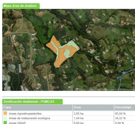
Imagen 1: Zonificación ambiental

De conformidad con la Resolución No. 112-4795 del 8 de noviembre del 2018 "Por medio de la cual se establece el régimen de usos al interior de la zonificación ambiental del Plan de ordenación y Manejo de la Cuenca Hidrográfica del Río Negro en la jurisdicción de CORNARE", los árboles objeto del aprovechamiento se encuentran en áreas: Agrosilvopastoriles : las cuales corresponden a aquellas áreas, cuyo uso agrícola, pecuario y forestal resulta sostenible, bajo el criterio de no sobrepasar la oferta de los recursos, dando orientaciones técnicas para la reglamentación y manejo responsable y sostenible de los recursos suelo, agua y biodiversidad que definen y condicionan el desarrollo de estas actividades, Y en el predio también se encuentran zonas en áreas: