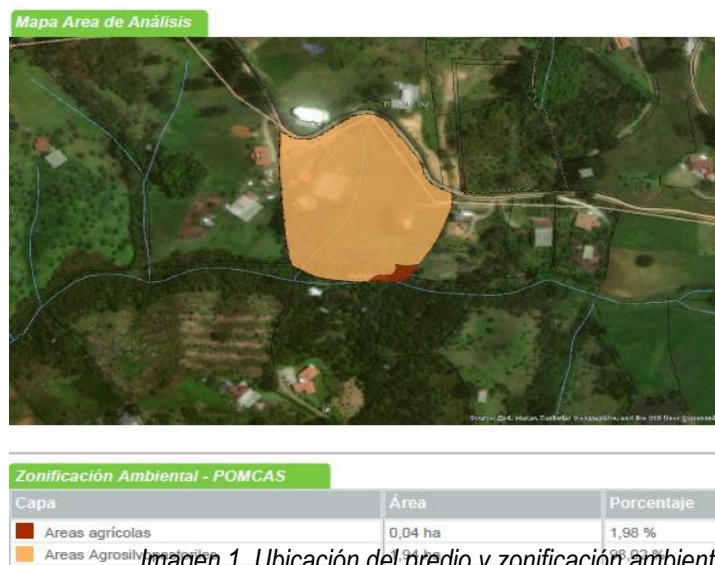
Imagen 1. Ubicación del predio y zonificación ambiental

De acuerdo con el Sistema de Información Geográfica de Cornare, el predio hace parte del área delimitada por el Plan de Ordenación y Manejo de la Cuenca Hidrográfica POMCA del Río Negro, aprobado en Cornare mediante la Resolución No. 112-7296 del 21 de diciembre de 2017, los árboles objeto de la solicitud se encuentran en áreas agrosilvopastoriles.