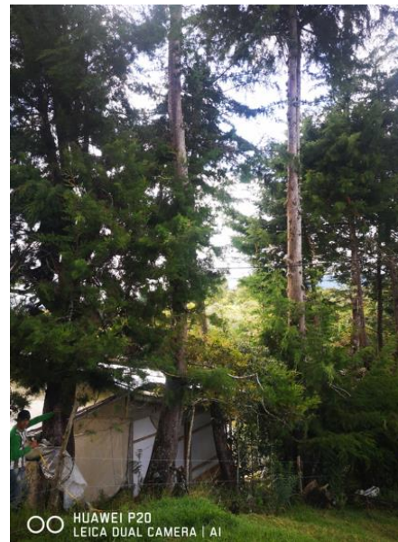
Imagen 2. Árboles objeto de la solicitud