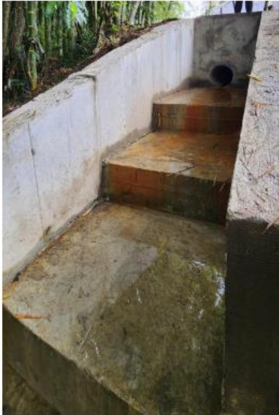
Descarga No. 1