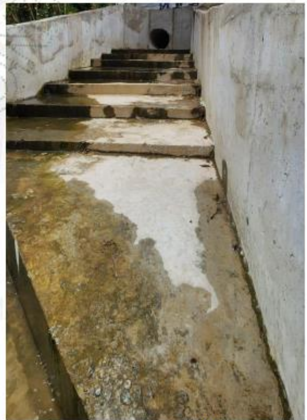
Descarga No. 3