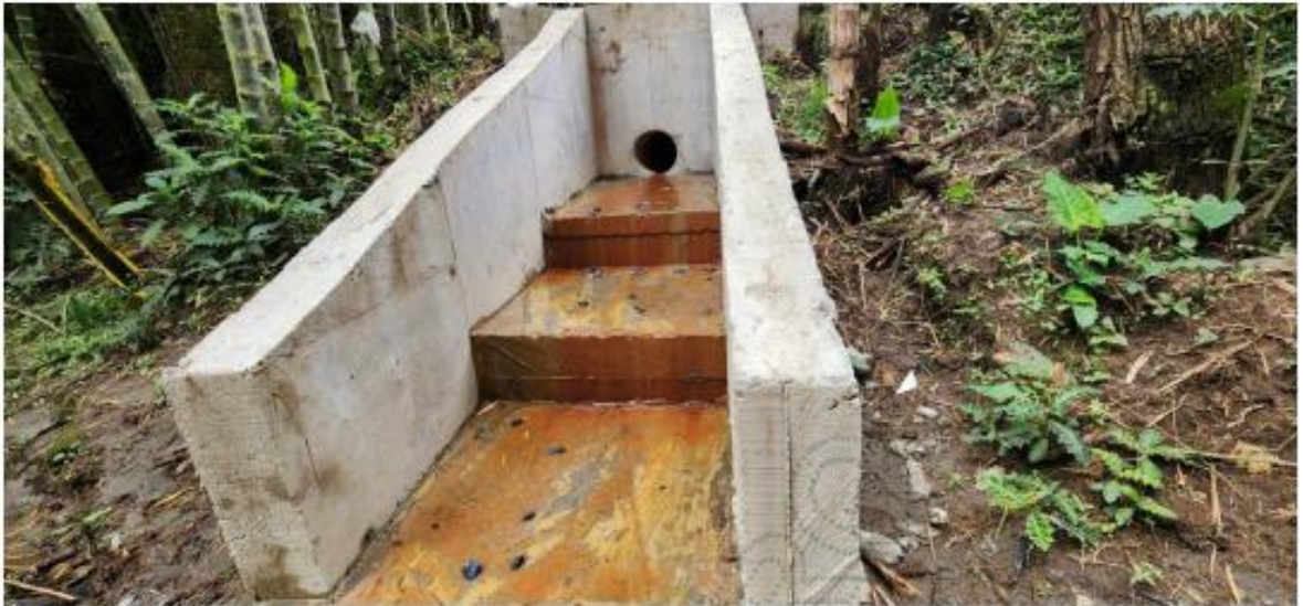
Descarga No. 2