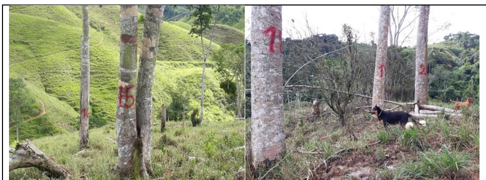
Se observan algunos de los árboles objeto de aprovechamiento

Con la información presentada por el solicitante es suficiente para conceptuar sobre el presente tramite.