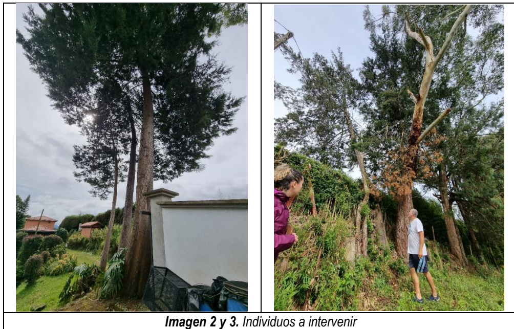
Imagen 2 y 3. Individuos a intervenir