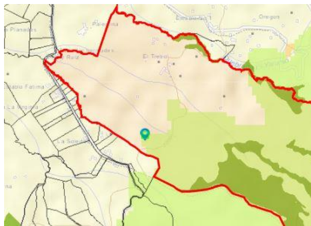
Imagen 2. Ubicación predio de interés Acuerdo 250 de 2011

El lote específicamente se ubica al interior del DRMI Cerros de San Nicolas, declarado mediante Acuerdo 323 de 2015 pero por medio del Acuerdo 376 de 2018 se realindera el DRMI y se sustrae definitivamente un área dentro de este. En esta sustracción se encuentra el predio de interés, por lo que se implementa la evaluación mediante el Acuerdo 250 de 2011 de Cornare, por el cual se establecen determinantes ambientales para efectos de la ordenación del territorio en la subregión de Valles de San Nicolas.