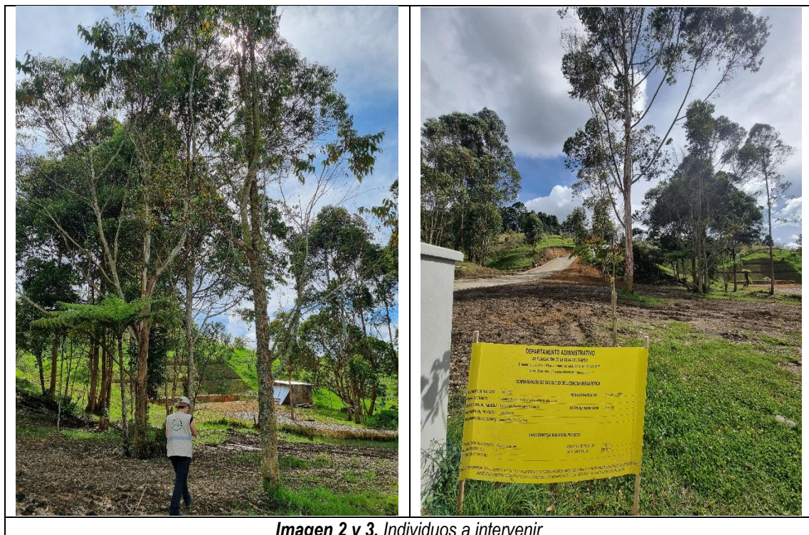
Imagen 2 y 3. Individuos a intervenir