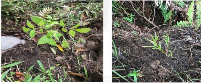
Fotografía 3 y 4. Guayacan ( Handroanthus chrysanthus ) y Sauce ( Salix ), registro de la siembra.

✓ En la parte alta del nacimiento se observó, que el terreno que había sido adecuado para actividades agrícolas fue sembrado con frijol, actividad que se llevó a cabo en un área aproximada a 200 metros cuadrados, parte de la siembra se encuentra dentro de la ronda hídrica del nacimiento de agua; de conformidad con lo establecido en el Acuerdo Corporativo 251 del 2011, la zona de protección para el nacimiento corresponde a 30 metros a la redonda.