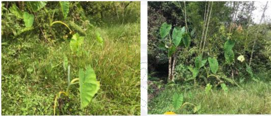
Fotografía 1 y 2. Estado de la zona del nacimiento de agua.