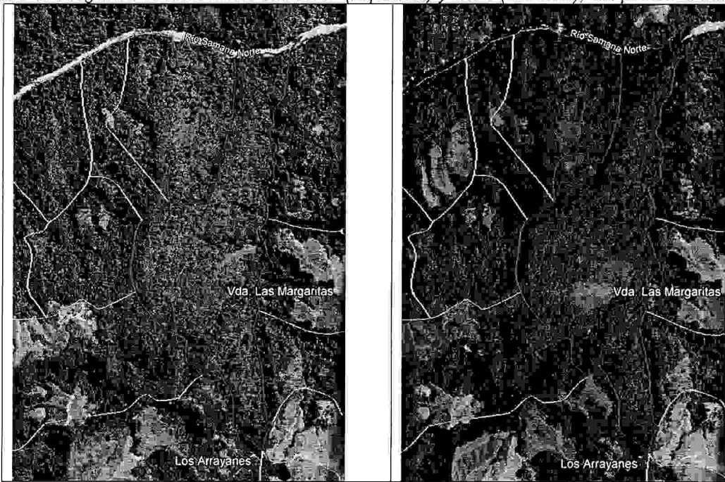
Figura 1. Imágenes satelitales del año 2015 (izquierda) y 2021 (derecha), del predio El Infierno

25.3. En la Resolución con radicado 134-0123 del 09 de septiembre de 2015, se otorgó al usuario un aprovechamiento de 329 m 3 de madera, en donde solo se aprovechó 158,15 m 3 , correspondiente al 48,07% del total autorizado para la primera unidad de corta.