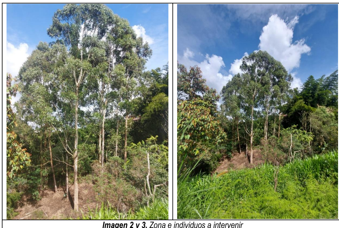
Imagen 2 y 3. Zona e individuos a intervenir