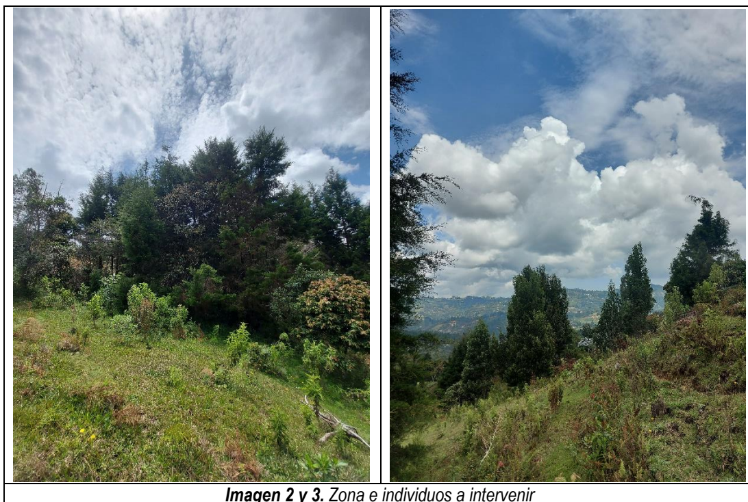
Imagen 2 y 3. Zona e individuos a intervenir