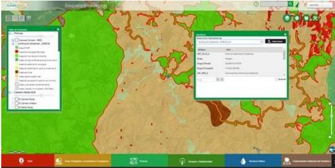
Imagen2, Fuente: Geoportal Cornare

La zona del predio donde se realizó la afectación se encuentra en área de zonificación ambiental del POMCA del río Arma (Resolución 112-0397-2019) en Categoría de ordenación: En áreas de importancia ambiental y Subzona de manejo: Áreas de conservación y protección ambiental. (Imagen 2)