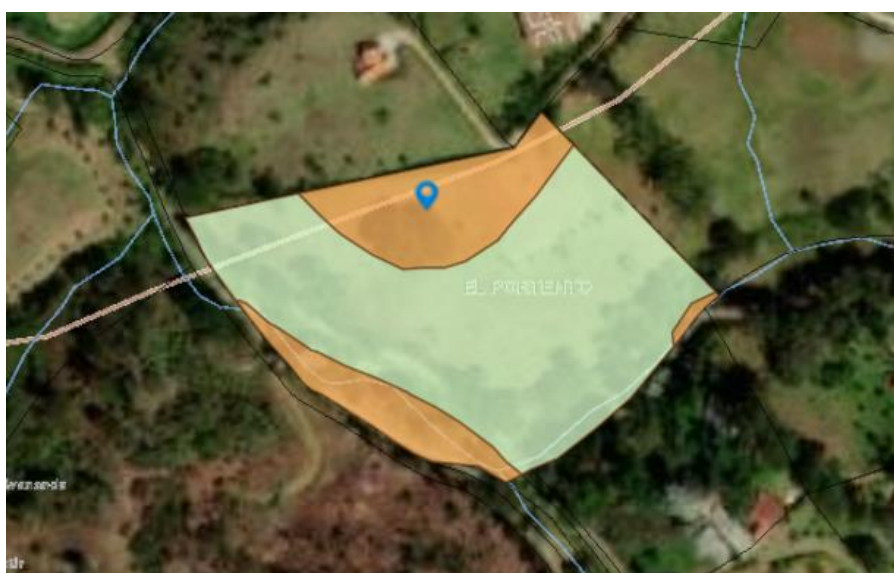
Zonificación Ambiental - POMCAS

De acuerdo con el Sistema de Información Geográfica de CORNARE, los predios donde se ubican los árboles de interés hacen parte del Plan de Ordenación y Manejo de la Cuenca Hidrográfica POMCA del Río Negro, aprobado en CORNARE mediante la Resolución No 112-7296 del 21 de diciembre del 21 de diciembre de 2017, (Imagen 1) y de conformidad con De conformidad con la Resolución No. 112-4795 del 8 de noviembre del 2018 "Por medio de la cual se establece el régimen de usos al interior de la zonificación ambiental del Plan de ordenación y Manejo de la Cuenca Hidrográfica del Río Negro en la jurisdicción de CORNARE", los árboles objeto de la solicitud se encuentra en áreas Agrosilvopastoriles : corresponden a aquellas áreas, cuyo uso agrícola, pecuario y forestal resulta sostenible, al estar identificadas como en la categoría anterior, bajo el criterio de no sobrepasar la oferta de los recursos, dando orientaciones técnicas para la reglamentación y manejo responsable y sostenible de los recursos suelo, agua y biodiversidad que definen y condicionan el desarrollo de estas actividades.