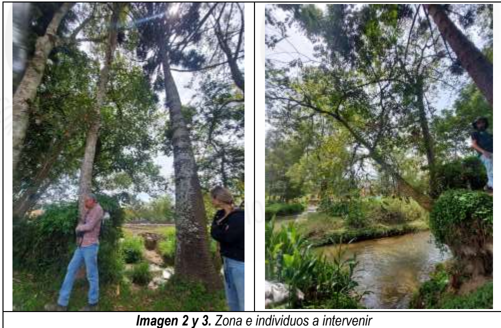
Imagen 2 y 3. Zona e individuos a intervenir