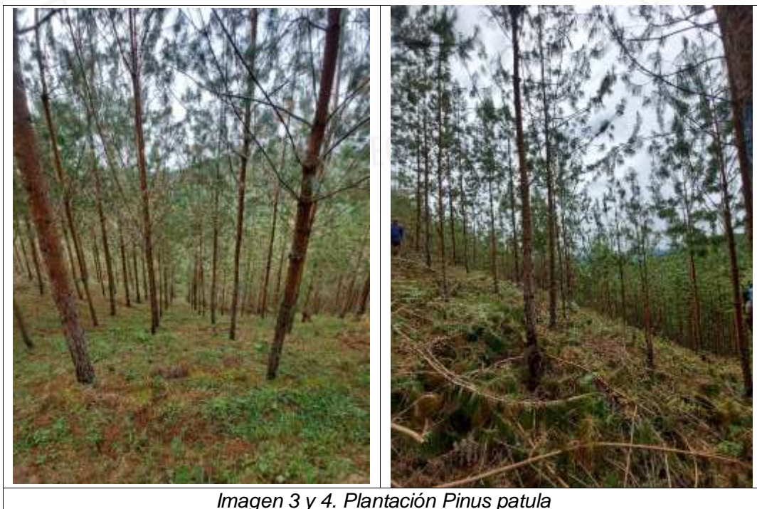
Imagen 3 y 4. Plantación Pinus patula

Ruta: \\cordc01\S.Gestion\APOYO\Gestión Jurídica\ Anexos\Ambiental\Tramites ambientales\Recurso Bosques\ R. Flora maderable y no maderable\Plantaciones Forestales