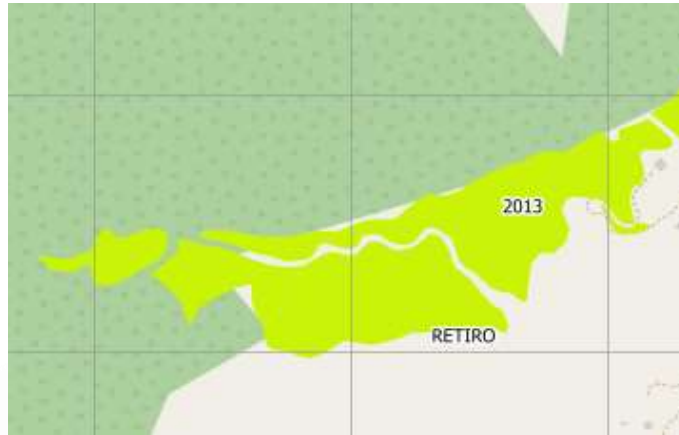
Imagen 1. Distribución plantación