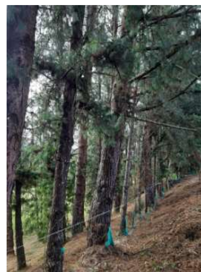
Individuos que conforman los cercos vivos.