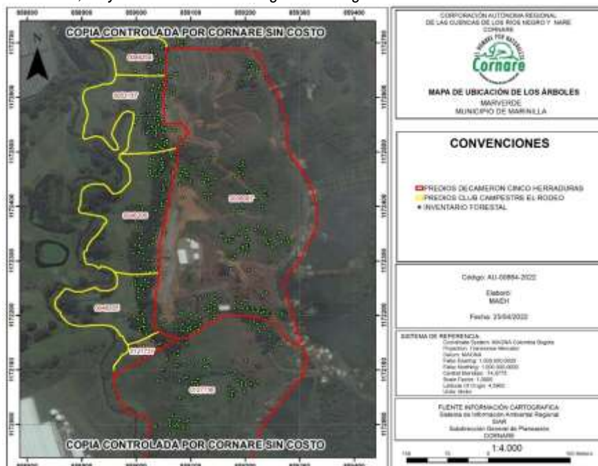
Imagen 1: Ubicación de los árboles respecto a los predios.

En relación con los predios, existen árboles aislados y árboles que conforman cercos vivos sobre el lindero con estos y al interior del Club, tal y como lo muestra la siguiente imagen: