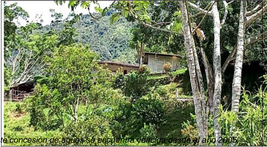
La presente concesión de aguas se encuentra vencida desde el año 2005.