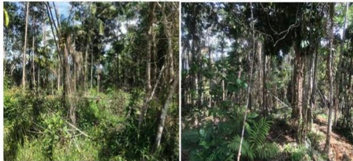
Figura 1. Suspensión de socola en bosque natural

Durante la visita al predio del señor Jaiber Erley Navia Rúa, no se evidenció actividades recientes que afecten los recursos naturales, y se apreció la suspensión de socola en bosque en estado se sucesión de aproximadamente 20 años, en la vereda Mulata del municipio de San Roque.