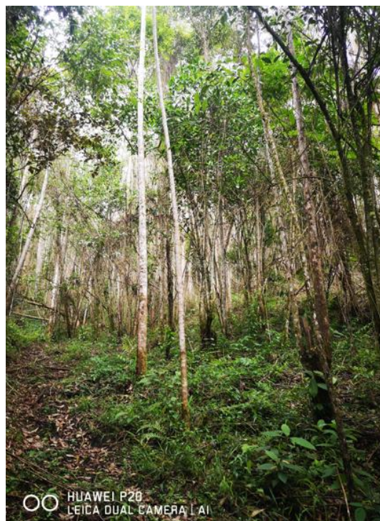
Imagen 3. Árboles objeto del aprovechamiento