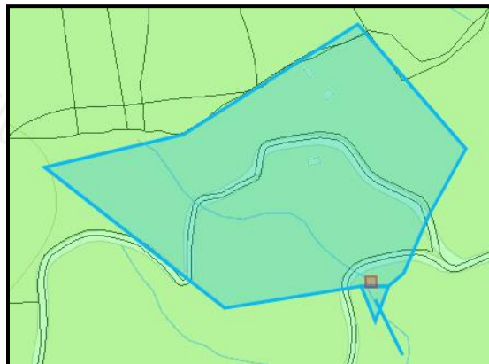
Imagen 3. Área de captación Fuente El Vergel

3.7 El área de captación de la Fuente El Vergel se calcula utilizando el Geoportal interno de la Corporación en las siguientes coordenadas Longitud: -75° 30' 16.441" Latitud 6° 7' 29.785" Z: 2308msnm WGS84, utilizando dos (2) variables: Distancias aguas abajo de 90 metros y radio de reubicación de 60 metros donde se implementó el método Cenicafé, dando un área aproximada de 7.55Ha .