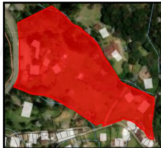
Imagen 1. Ubicación predio FMI 017-739

3.3 Según el Sistema de información Geográfico de Cornare El predio de interés identificado con FMI 017-739 se encuentra ubicado en la vereda Los Salados del municipio de El Retiro y tiene un área de 3.0137Ha.