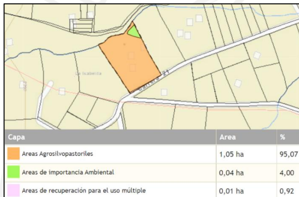
Figura 3. Determinantes ambientales predio con FMI 017-2898