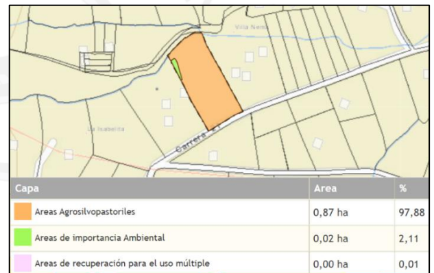
Figura 4. Determinantes ambientales predio con FMI 017-2900

Los predios identificados con (F.M.I) N° 017-2898 y 017-2900 presenta restricciones ambientales por estar ubicado en los límites del Plan de Ordenación y Manejo de la Cuenca Hidrográfica (POMCA) del Río Negro aprobado mediante la Resolución Corporativa con Radicado N°112-7296 del 21 de diciembre del 2017 y se establece el régimen de usos al interior de la zonificación ambiental en la Resolución 112-4795 del 8 de noviembre del 2018, donde según el sistema de información geográfico los predios se encuentra en: