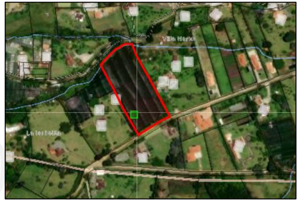
Figura 2. Predio con FMI 017-2900