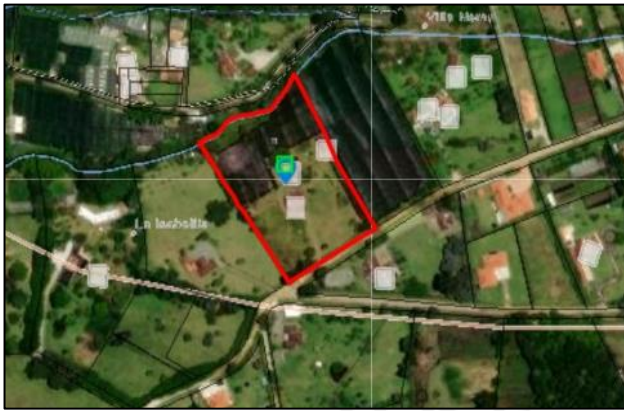
Figura 1. Predio con FMI 017-2898