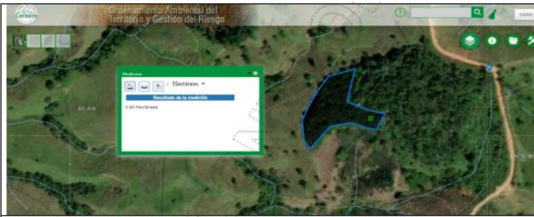
Se delimita el área del bosque que fue afectada con las acciones de tala rasa.