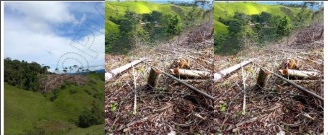
Evidencia fotográfica de la tala rasa