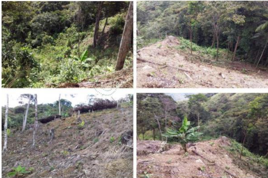
Imágenes de la visita realizada