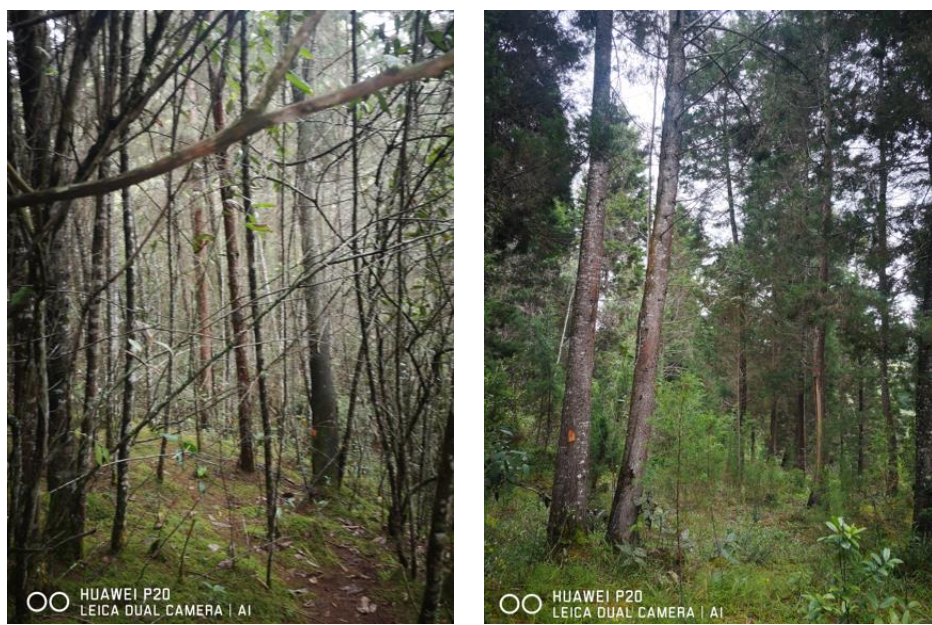
Imagen 2. Árboles objeto del aprovechamiento