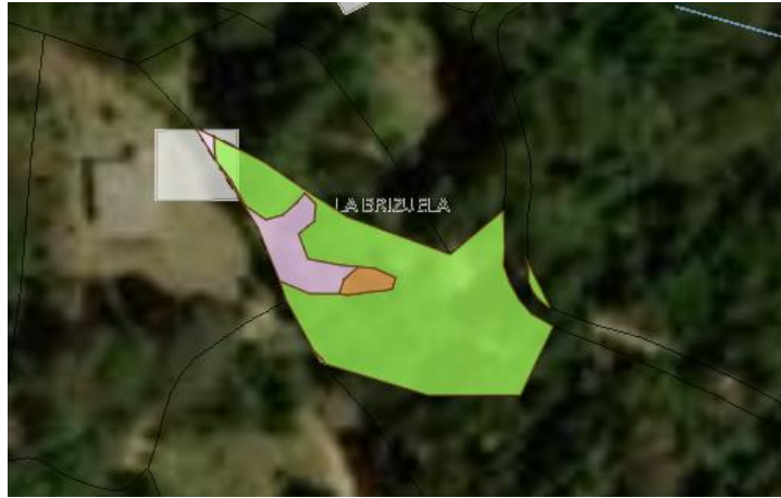
Zonificación Ambiental - POMCAS