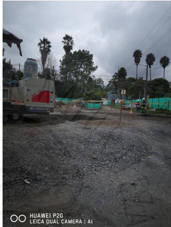
Imagen 4. Zona donde se encontraban ubicados los cinco árboles aprovechados y que se encuentra en construcción.