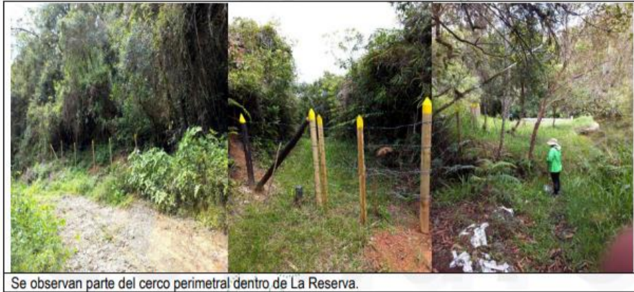
Se observan parte del cerco perimetral dentro de La Reserva.

Al interior de la reserva se observa un debido proceso de regeneración natural de las áreas que presentaban pérdida de cobertura vegetal por pastoreo y apisonamiento de los semovientes que ingresaban sin autorización.