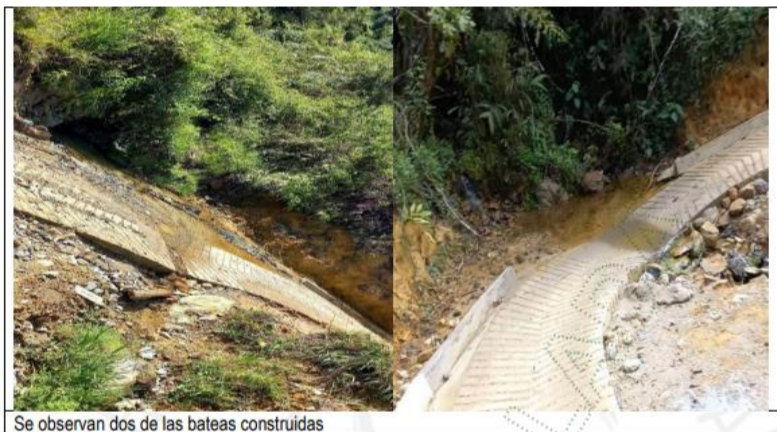
Se observan dos de las bateas construidas

Las bateas (obra civil en concreto) construida conserva los parámetros del cauce tanto en lo ancho como en lo profundo, por lo que dicha obra no obstaculiza el libre flujo de su caudal y/o representa un cambio negativo sobre el ecosistema de la zona.