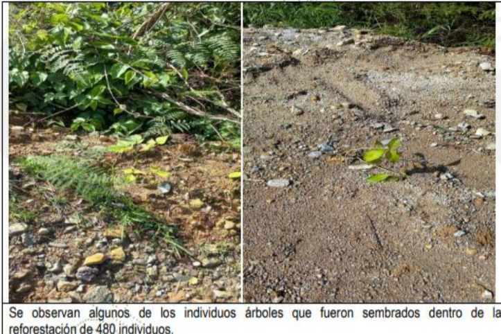
Se observan algunos de los individuos árboles que fueron sembrados dentro de la reforestación de 480 individuos.

tales como, Balsos, Gallinazos, Espaderos, Yarumos, Laureles etc. Estos individuos a la fecha presentan un buen estado fitosanitario.